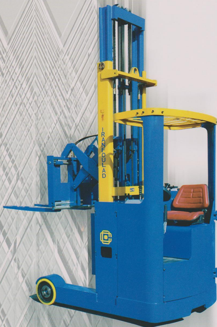
Reach truck RS15